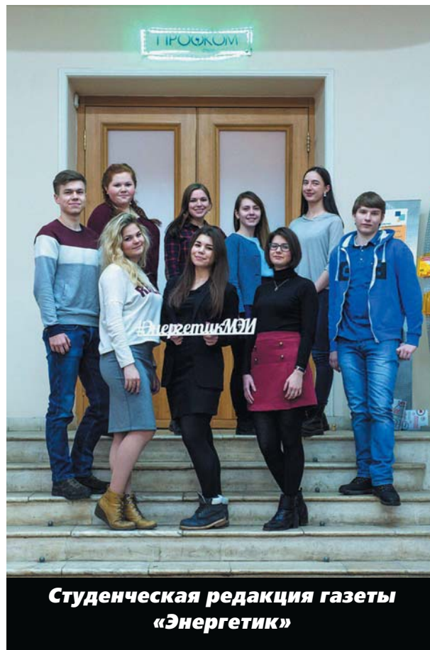
Студенческая редакция газеты «Энергетик»