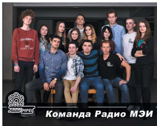
Команда Радио МЭИ

Что вы можете увидеть? Репортажи о событиях внутри университета, специальные программы о проектах МЭИ, интервью со студентами, преподавателями, которые публикуются 1-2 раза в неделю на YouTube канале.